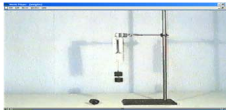
Σχήμα 2: Βίντεο με το πείραμα « ένα αντικείμενο πάνω σε ένα ελατήριο (νόμος του Hooke) »

Οι μαθητές αρχικά βλέπουν το βίντεο και τους ζητάμε να μας διηγηθούν τι συμβαίνει (όπως εμφανίζεται στο σχήμα 2).