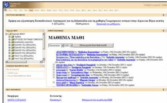
Σχήμα 2: Στιγμιότυπο της Ιστοσελίδας του μαθήματος με κωδικό ΜΑΘ1.

Όσον αφορά στον παράγοντα «αυτότητα», δόθηκε έμφαση στην έκφραση κριτικής και πολιτικής σκέψης εντός της Κοινότητας και στην ανάπτυξη δημιουργικότητας, αισθητικής και δεοντολογίας. Η ύπαρξη κριτικής και πολιτικής σκέψης σε ένα τεχνολογικό περιβάλλον είναι αναγκαία για να μην μετατραπούν οι χρήστες σε παθητικούς αποδέκτες αλλά και για την αύξηση της συμμετοχής τους στα δρώμενα. Στην ΚΜΕ οργανώνονται από τους συντονιστές ανοιχτές συζητήσεις στις οποίες συμμετέχουν όλα τα μέλη, επιδιώκεται η ανατροφοδότηση του διαλόγου, δίνεται έμφαση στον αναλογισμό των στόχων, της χρήσης των μεθόδων και των τεχνολογιών.