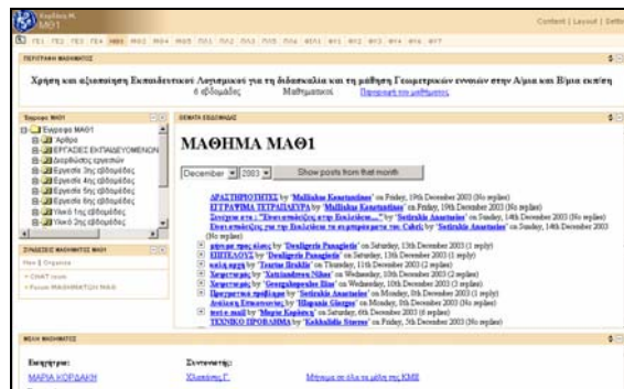
Σχήμα 2: Στιγμιότυπο της Ιστοσελίδας του μαθήματος με κωδικό ΜΑΘ1.

Όσον αφορά στον παράγοντα «αυτότητα», δόθηκε έμφαση στην έκφραση κριτικής και πολιτικής σκέψης εντός της Κοινότητας και στην ανάπτυξη δημιουργικότητας, αισθητικής και δεοντολογίας. Η ύπαρξη κριτικής και πολιτικής σκέψης σε ένα τεχνολογικό περιβάλλον είναι αναγκαία για να μην μετατραπούν οι χρήστες σε παθητικούς αποδέκτες αλλά και για την αύξηση της συμμετοχής τους στα δρώμενα. Στην ΚΜΕ οργανώνονται από τους συντονιστές ανοιχτές συζητήσεις στις οποίες συμμετέχουν όλα τα μέλη, επιδιώκεται η ανατροφοδότηση του διαλόγου, δίνεται έμφαση στον αναλογισμό των στόχων, της χρήσης των μεθόδων και των τεχνολογιών.