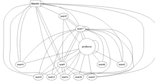
Σχήμα 3: Δείγμα γράφου επικοινωνίας για ένα συγκεκριμένο Κοινωνικό Δίκτυο που αποτελείται από τα μέλη (ελλείψεις) ενός μαθήματος, τον εισηγητή (κύκλος) και το συντονιστή (τετράγωνο).

κάποιο μάθημα που βρίσκεται σε εξέλιξη. Παράμετροι της παραπάνω ανάλυσης που υπολογίζονται είναι η πυκνότητα και η συγκέντρωση των δικτύων, καθώς και οι γράφοι επικοινωνίας (σχήμα 3) - απεικονίζουν γραφικά όλη την αλληλεπίδραση και τη επικοινωνία που συντελέστηκε σε ένα συγκεκριμένο χρονικό διάστημα, π.χ. μια εβδομάδα- (Χλαπάνης κ.α. 2004).